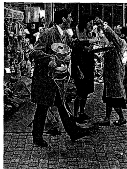
À la quincaillerie Parpassanton, on trouve de tout. Un régal avec cette troupe aux faux-airs des Deschiens.

Une blouse grise, la cravate, la raie sur le côté. On se croirait revenu quelques dizaines d'années en arrière, avec des quincailliers un brin austère. C'était hier, sur la place Jeannie-Mazurelle, à La Roche-sur-Yon, avec la compagnie Cirkatomic, qui n'est pas sans rappeler les si fameux Deschiens. Dans la quincaillerie Par-