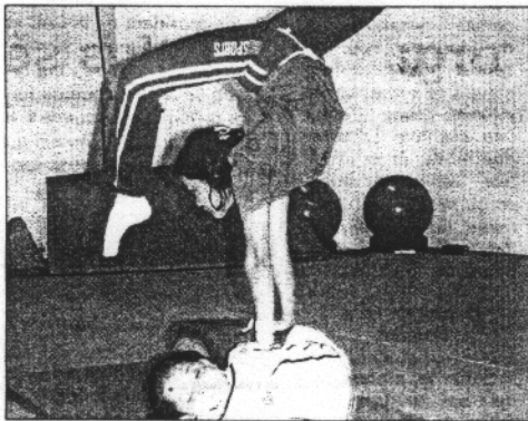
Les jeunes artistes partiront ensuite en tournée dans toute la France.