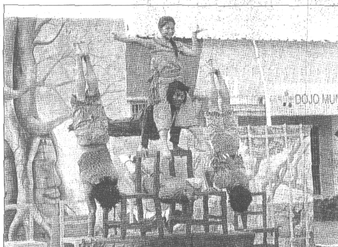
Numéros époustouflants, mais aussi fragilité pour un cirque haut en couleurs. Le public a pu découvrir quelques prouesses de la troupe.

Cousins. Bref on se régale, on décolle pour ne ré-atterrir qu'une bonne heure plus tard avec une furieuse envie d'acheter un billet d'avion pour Bat-tambang, seconde ville du Cambodge près de laquelle ce cirque est né et continue de grandir.