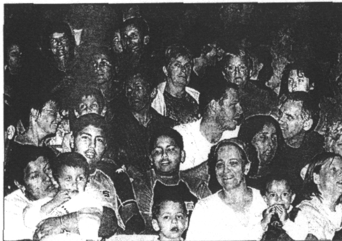
La salle du centre des congrès avait encore fait le plein.

Un peu d'illusion, un peu de musique savamment distillée par des instruments très hétéroclites, (tuyaux, raquettes de ping pong, etc), beaucoup de mouvements, beaucoup d'imagination et beaucoup de talent transpi-